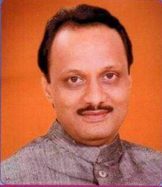
मा.श्री. अजितदादा पवार साहेब