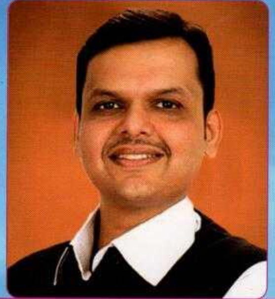
मा.श्री. देवेन्द्रजी फडणवीस साहेब